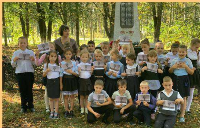
Акция "Цветы Памяти"