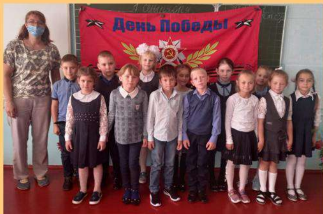
Урок, посвященный 75-летию Победы